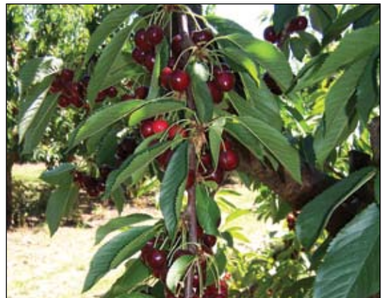
Paso #1. Quite todas las ramas pendientes o delgadas.

¿Por qué?—Estos cortes remueven las ramas que tienden a producir demasiado fruto y fruto pequeño.