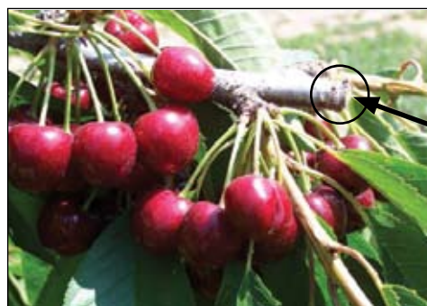
troncón en ramas

Paso #2. Haga el troncón en ramas para reducir la carga frutal del año presente y para renovar las ramas fructíferas y los espolones.